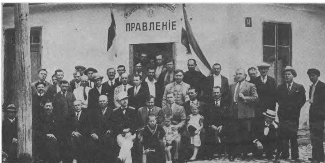
Смедеревская ВК станица в день своего праздника